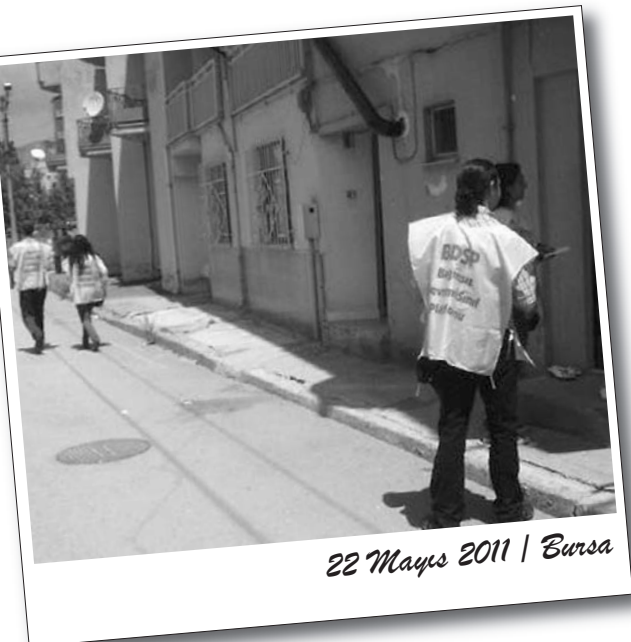
22 Mayıs 2011 | Bursa

Bildiri dağıtımını sırasında yapılan ajitasyon konuşmalarında, sermaye düzeninin işçi ve emekçilere gelecek ve özgürlük sunamayacağı, tüm düzen partilerinin Amerikancı, NATO'cu ve IMF'ci olduğu söylendi. İşçi ve emekçilere düzenin seçim oyununu bozma çağrısı yapılarak, oy pusulalarına "Çözüm devrimde, kurtuluş sosyalizmde!" şiarını yazmaları istendi.