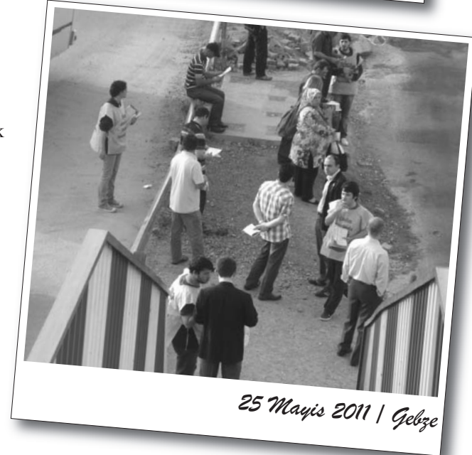
25 Mayıs 2011 | Gebze

Emekçi mahallelerindeki dağıtımlarda ise yoğun ilgiyle karşılaşan BDSP'liler emekçilerle seçim üzerine sohbetler gerçekleştirdiler.