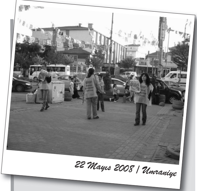
22 Mayıs 2008 | Ümraniye

Toplantıda somut planlamalar yapılarak bir dizi mahallede toplantı alındı. Toplantı 5 Haziran'da BDSP'nin düzenleyeceği seçimler panelinin duyurusuyla sonlandırıldı. Sonrasında yeniden serbest saate geçildi, kolektif bir emekle kurulan sofralarda yemek yenildi. Ardından hep bir ağızdan türküler, marşlar söylendi ve halaylar çekilerek piknik sonlandırıldı.