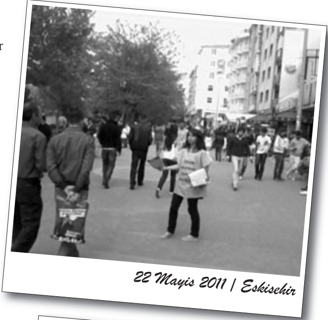
22 Mayıs 2011 | Eskişehir

BDSP'liler üzerinde "Çözüm devrimde kurtuluş sosyalizmde!" yazan önlükler giyerek dağıtım yaptılar.